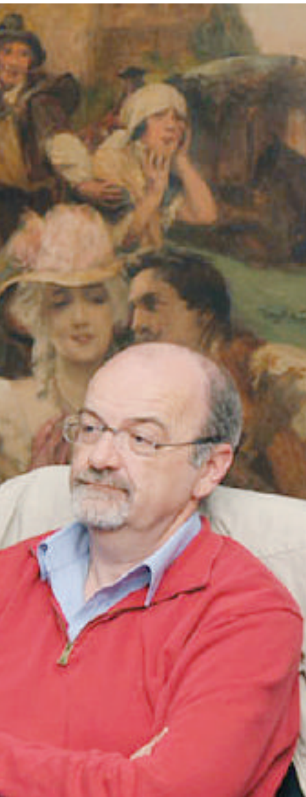
...tazione del programma